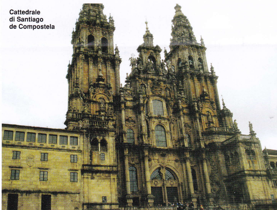
Cattedrale di Santiago de Compostela