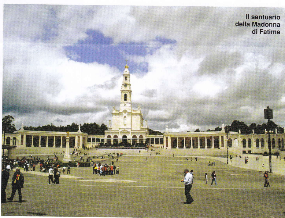
Il santuario della Madonna di Fatima