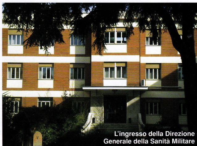
L'ingresso della Direzione Generale della Sanità Militare

Il primo Direttore Generale della Sanità Militare fu il Tenente Generale medico Francesco Iadevaia che assume la carica il 31.12.1966, mentre l'ultimo Direttore Generale è stato il Generale Ispettore Capo CSA Ottavio Sarlo, che ha lasciato l'incarico il 2 marzo 2012. Attualmente il Gen. Sarlo assolve le funzioni di Capo del Corpo Sanitario Aeronautico.