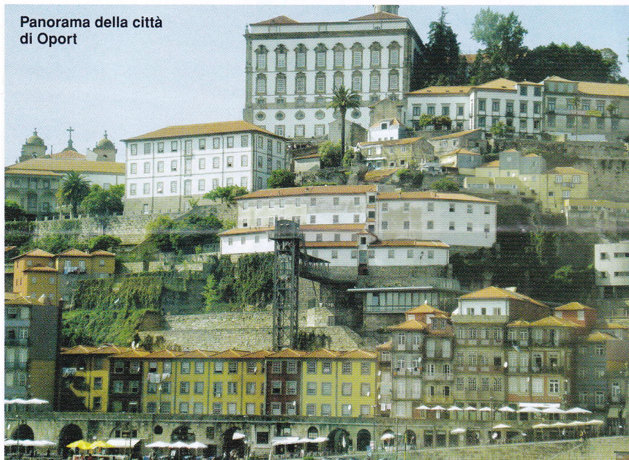
Panorama della città di Oport